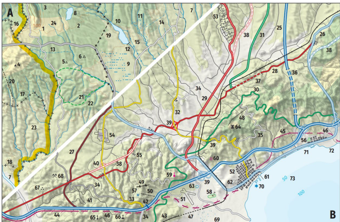
Figura 1. Territori simulat a fi d'identificar tots els signes convencionals del mapa