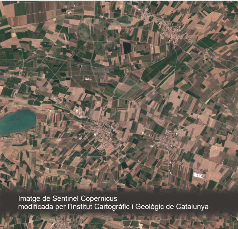
Imatge de Sentinel Copernicus modificada per l'Institut Cartogràfic i Geològic de Catalunya