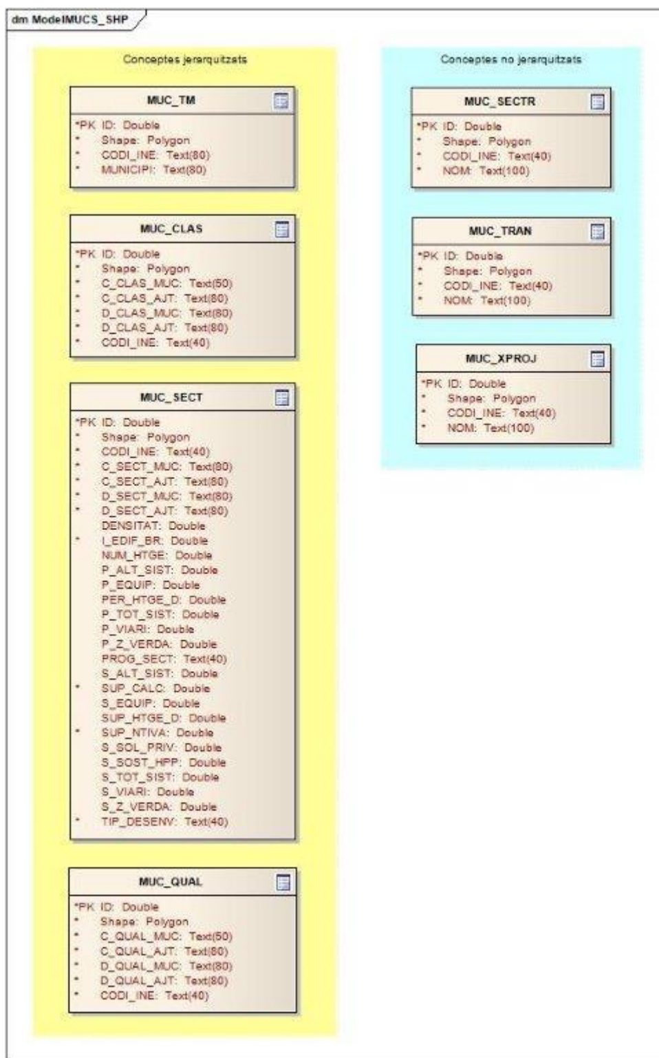
Figura 1 - Diagrama de classes UML del model de dades físic del Mapa urbanístic de Catalunya sintètic v1.2 per al format Shapefile