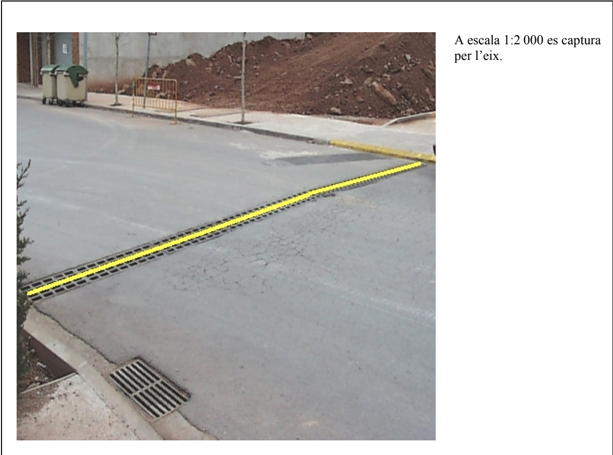
A escala 1:2 000 es captura per l'eix.