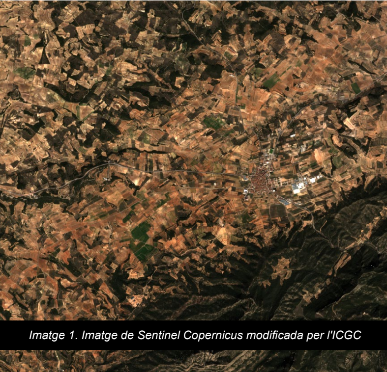
Imatge 1. Imatge de Sentinel Copernicus modificada per l'ICGC

ICGC Institut Cartogràfic i Geològic de Catalunya